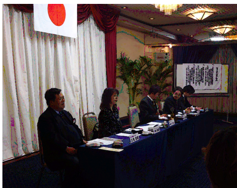
2月 19日(火)7R委員会則委員 L小谷の例会訪問