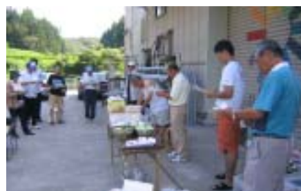
9/3 バーベキュー例会