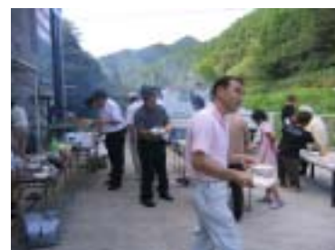
お世話をされる白・委員長